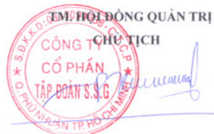
NGUYỄN HỒNG PHƯƠNG

Hiện tại tổng số Cổ phần của Công ty Cổ phần Tập đoàn SSG phát hành là 55.000.000 cổ phần, do đó điều kiện nêu tại mục 1 là cổ đông hoặc nhóm cổ đông phải sở hữu 5.500.000 cổ phần trở lên mới có quyền đề cử người vào Hội đồng quản trị.